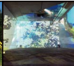
井藤雄一 Yuichi Ito