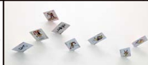
泉孝昭 Takaaki Izumi