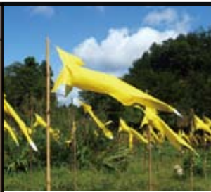
石松丈佳 Takeyoshi Ishimatsu