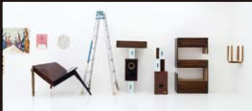
徳重道朗 Michiro Tokushige