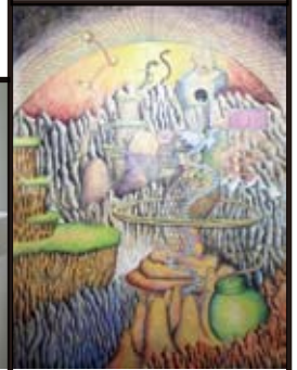
設楽陸 Riku Shitara